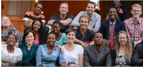
De unge i Promissio har et netværk der hedder PromissioYouth.