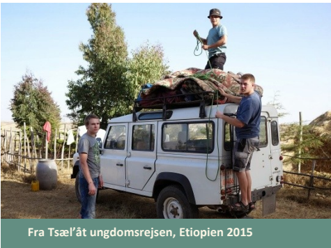
Fra Tsæl'åt ungdomsrejsen, Etiopien 2015