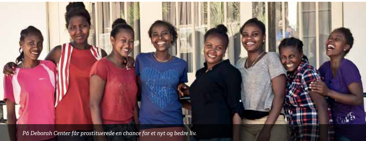
På Deborah Center får prostituerede en chance for et nyt og bedre liv.