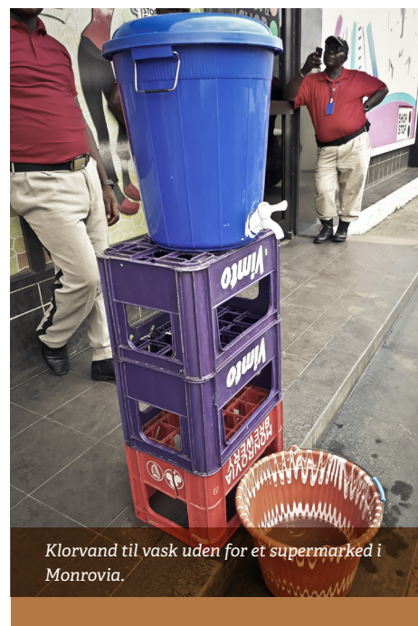
Klorvand til vask uden for et supermarked i Monrovia.

For mig betyder alt dette, at jeg sidder på Færøerne og arbejder hjemmefra. Jeg rejste ud af Liberia den 18. marts, da flyruterne begyndte at lukke, og jeg ved ikke, hvornår jeg kan komme tilbage til Liberia. ●