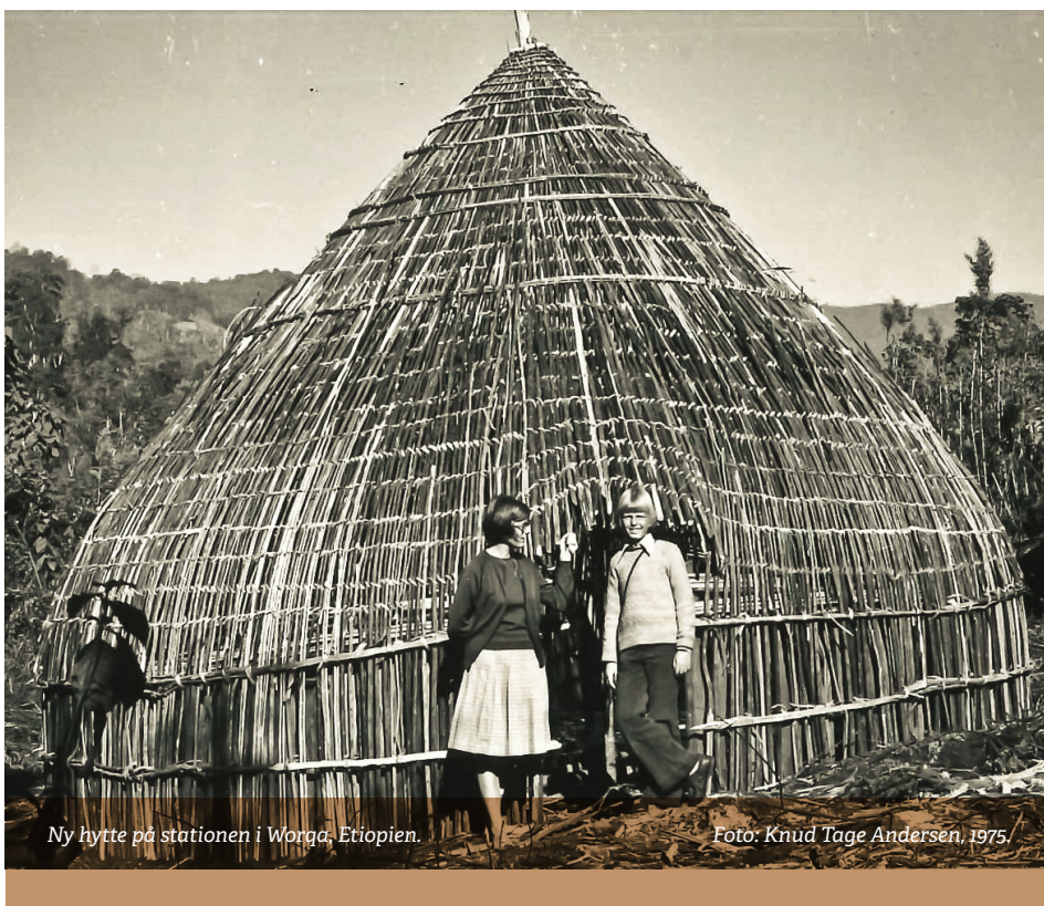
Ny hytte på stationen i Worqa, Etiopien.

Mens foreningerne har hentet opbakning hos enkeltpersoner i folkekirken, er der også eksempler på, at missionsbevægelsen udgør en integreret del af en bestemt menigheds arbejde. Det gælder især de evangeliske frikirker, i dag mest Mosaik (pinsebevægelsen) og Apostolsk kirke.