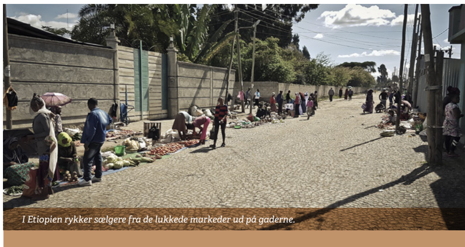
I Etiopien rykker sælgere fra de lukkede markeder ud på gaderne.