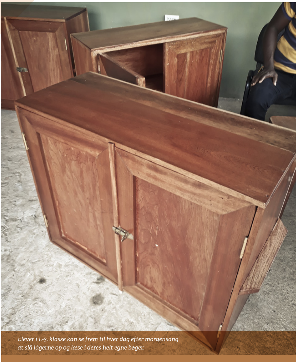
Elever i 1.-3. klasse kan se frem til hver dag efter morgensang at slå lågerne op og læse i deres helt egne bøger.

Men bøgerne var pakket i slidte gamle papkasser, og jeg kunne se, at det ikke var en holdbar løsning at distribuere dem til skolerne i den forfatning.