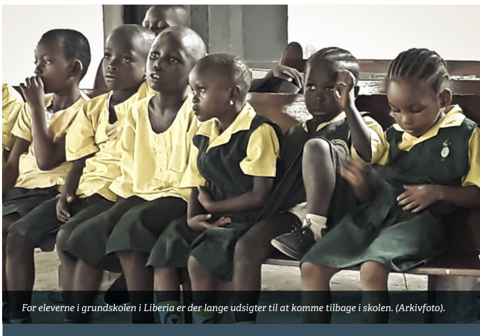
For eleverne i grundskolen i Liberia er der lange udsigter til at komme tilbage i skolen. (Arkivfoto).