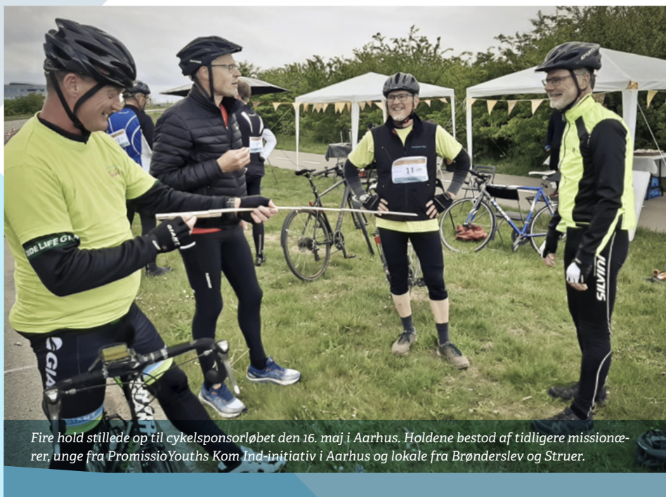
Fire hold stillede op til cykelsponsorløbet den 16. maj i Aarhus. Holdene bestod af tidligere missionærer, unge fra PromissioYouths Kom Ind-initiativ i Aarhus og lokale fra Brønderslev og Struer.

Hans cykeltur var én ud af en række lokale initiativer i Brabrand, Horsens, Aalborg, Galten og Herlev, hvor børn, unge