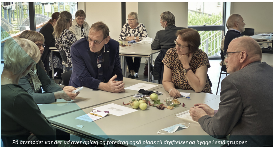
På årsmødet var der ud over oplæg og foredrag også plads til drøftelser og hygge i små grupper.