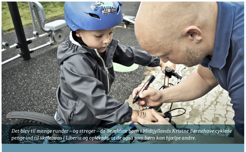
Det blev til mange runder – og streger – da de ældste børn i Midtjyllands Kristne Børnehave cyklede penge ind til skolebørn i Liberia og oplevede, at de også som børn kan hjælpe andre.

»Vi har snakket om, at når de har samlet så mange penge ind, er det så og så mange bøger, blyanter, farvekridt og