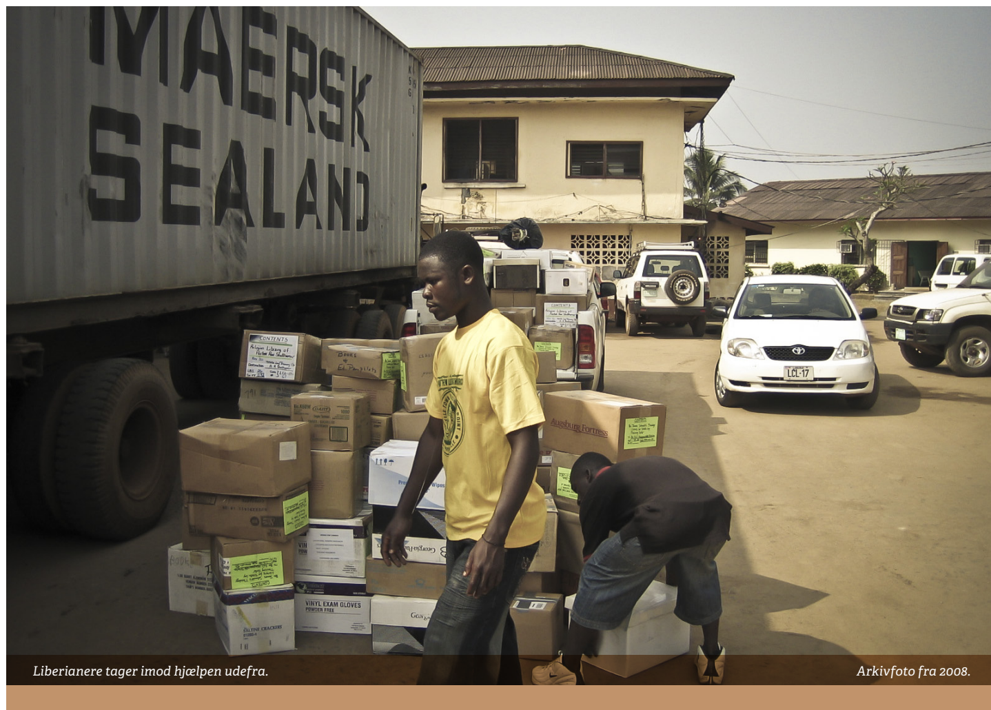
Liberianere tager imod hjælpen udefra.

Dermed er der stadig meget af landets nutid, som har trådt tilbage i historien, og det har betydning for, hvorfor Liberia ikke har udviklet sig i takt med andre afrikanske lande. ●