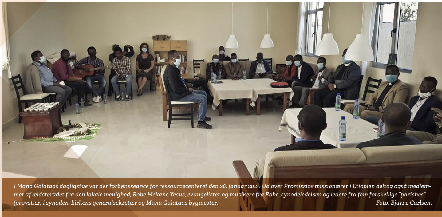
I Mana Galataas dagligstue var der forbønssance for ressourcecenteret den 26. januar 2021. Ud over Promissios missionærer i Etiopien deltog også medlemmer af ældsterådet fra den lokale menighed, Robe Mekane Yesus, evangelister og musikere fra Robe, synodeledelsen og ledere fra fem forskellige "parishes" (provstier) i synoden, kirkens generalsekretær og Mana Galataas bygmester.

»Jeg håber og drømmer om, at brugerne af stedet vil sende tak til Gud for den, Han