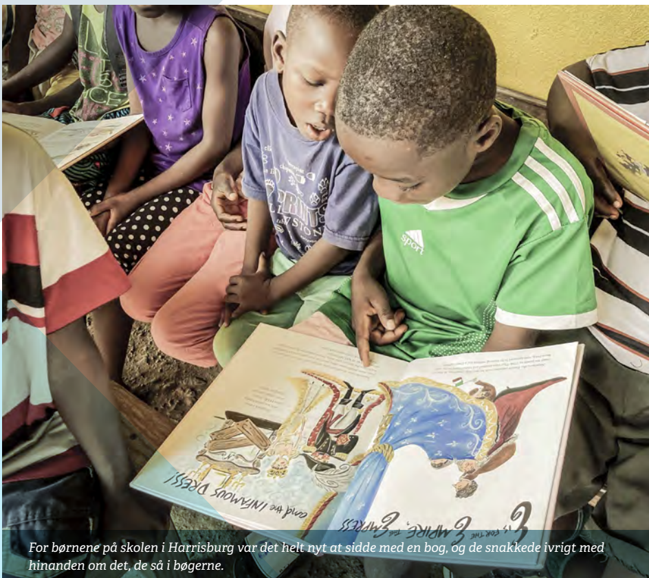
For børnene på skolen i Harrisburg var det helt nyt at sidde med en bog, og de snakkede ivrigt med hinanden om det, de så i bøgerne.