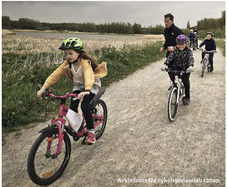
Arkivfotos fra cykelsponsorløb i 2020