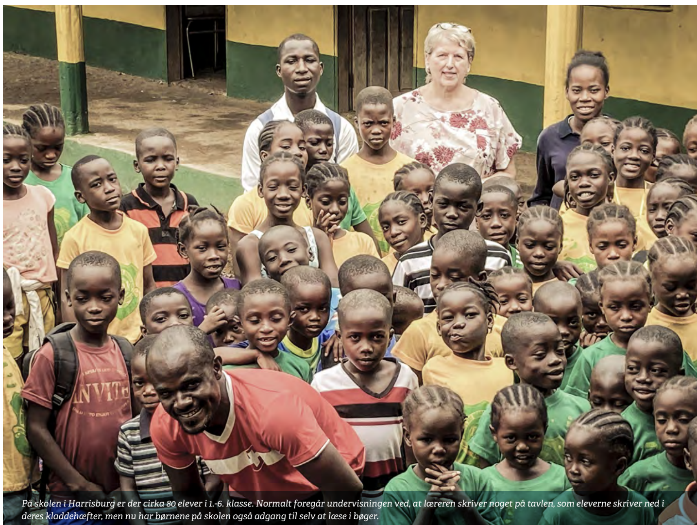
På skolen i Harrisburg er der cirka 80 elever i 1.-6. klasse. Normalt foregår undervisningen ved, at læreren skriver noget på tavlen, som eleverne skriver ned i deres kladdehefter, men nu har børnene på skolen også adgang til selv at læse i bøger.

Den Lutherske Skole i Harrisburg har lanceret et sponsorprogram, der hedder "One take one" og målet er at give 50 børn et et-årigt scholarship (det vil sige det, det koster for et skoleår). Prisen for et års skolegang er 50 USD, og de har indtil videre fået støtte til 40 scholarships.