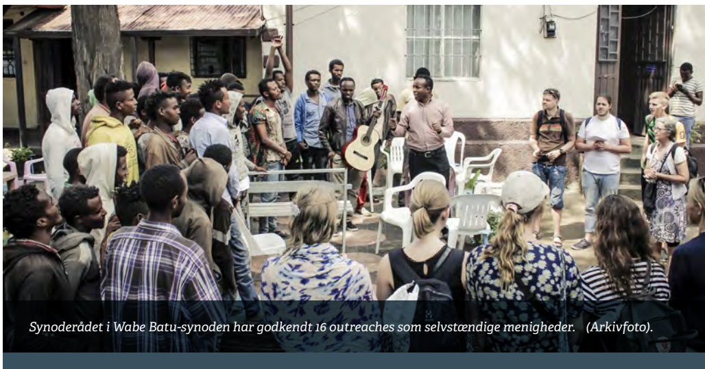
Synoderådet i Wabe Batu-synoden har godkendt 16 outreaches som selvstændige menigheder. (Arkivfoto).