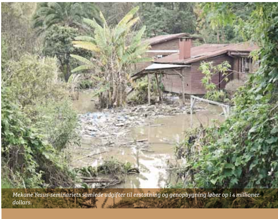
Mekane Yesus-seminariets samlede udgifter til erstatning og genopbygning løber op i 4 millioner dollars.