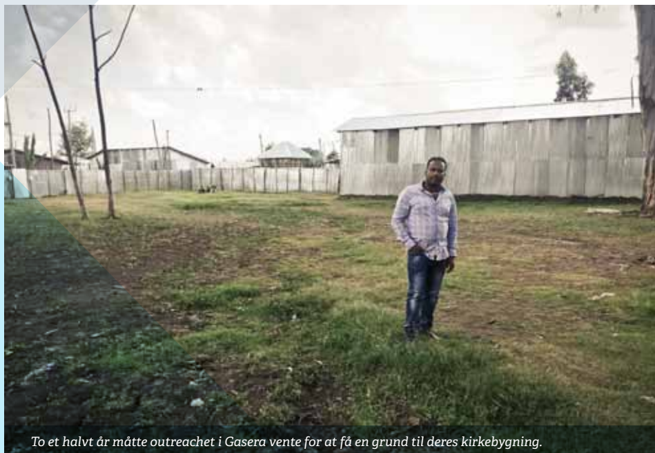
To et halvt år måtte outreachet i Gasera vente for at få en grund til deres kirkebygning.

Det lykkedes for outreachet at få et fint