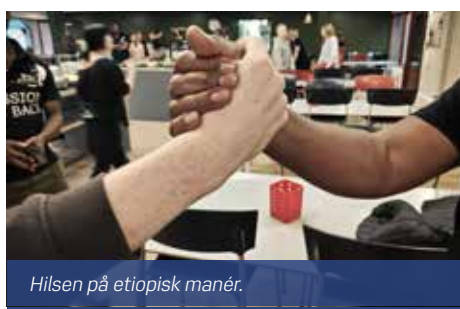
Hilsen på etiopisk manér.