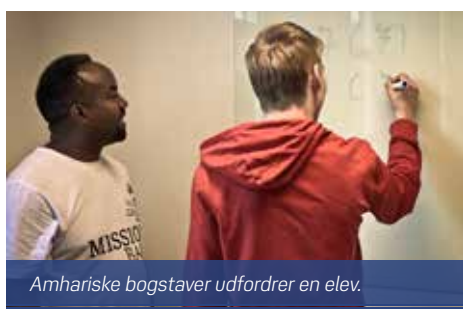
Amhariske bogstaver udfordrer en elev.