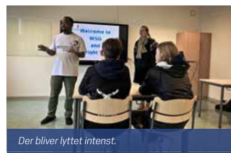
Der bliver lyttet intenst.