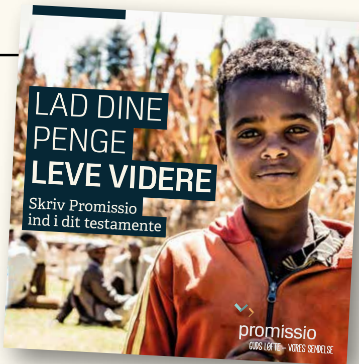
Promissios folder om at testamenterere kan også hentes på www.promissio.dk/testamente .

»Hvis midlerne bare går til almindelig drift, bliver det sværere at styre i forhold til, om Promissio kommer ud med over- eller underskud. På denne måde får vi brugt arvemidlerne til gode projekter, som ellers ikke var blevet til noget, og samtidig kommer vi ikke til at få problemer med pludselige underskud i tilfælde af faldende indtægter fra den almindelige indsamling af penge.«