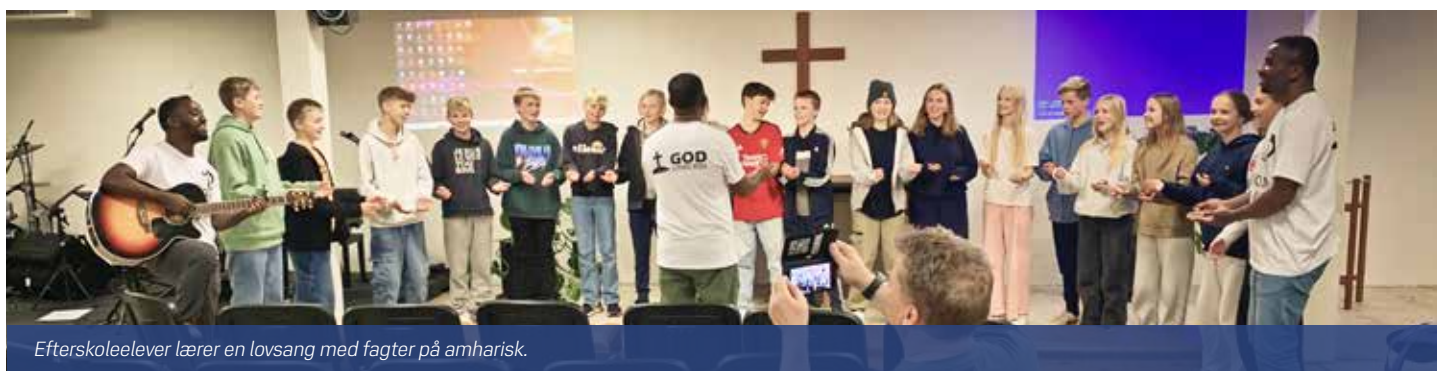
Efterskoleelever lærer en lovsang med fagter på amharisk.