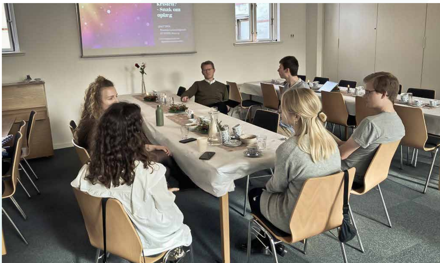
Efter dagens oplæg var de unge samlet til en drøftelse om det at være global, ung kristen.

Af Anja E. D. Nedergaard, markedsføringskoordinator